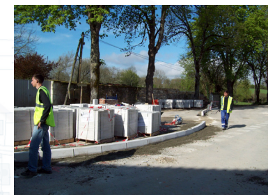
Avancement des travaux