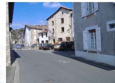
Avancement des travaux