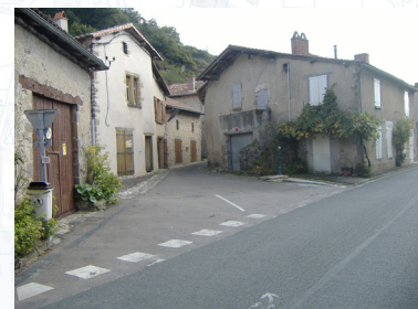
Début des travaux